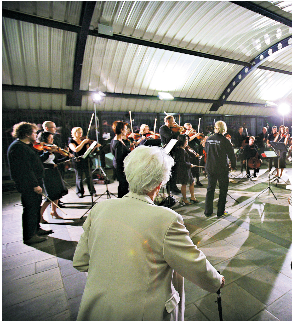
25 strykere fra Kringkastingsorkesteret (KORK) sørget for vakre Grieg-toner i en uvanlig setting på Stortinget stasjon. På repertoaret sto blant annet «Holberg-suiten» og «Våren»